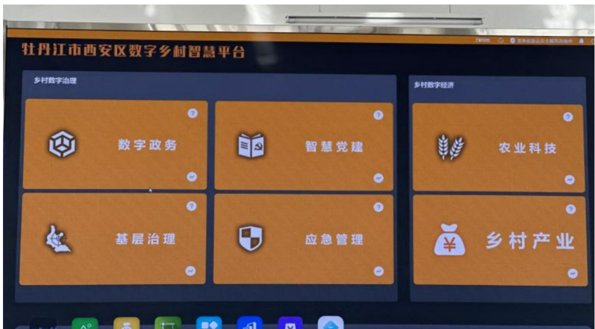
图5 西安数字乡村智慧平台六大功能板块

了数字乡村智慧平台，该平台分为后台管理和前台服务两个端口，后台管理涵盖“数字政务、智慧党建、基层治理、应急管理、智慧农业、乡村产业”六大类功能版块，前台服务则是通过“雪城e西安”APP实现交互式用户服务。平台的建立真正架起了人居环境治理的“数字”桥，打通了服务村民群众的“最后一厘米”。