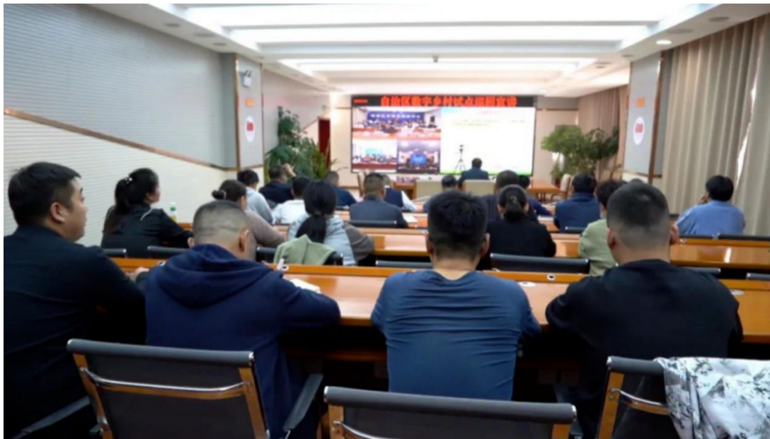
图4 自治区数字乡村试点巡回宣讲现场