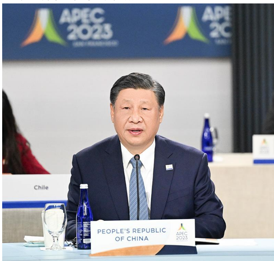
图1 习近平在亚太经合组织第三十次领导人非正式会议上发表重要讲话

11月17日，亚太经合组织第三十次领导人非正式会议在美国旧金山莫斯科尼中心举行。国家主席习近平出席会议并发表题为《坚守初心 团结合作 携手共促亚太高质量增长》的重要讲话。习近平提出，中国坚持创新驱动发展战略，协同推进数字产业化、产业数字化，提出了亚太经合组织数字乡村建设、企业数字身份、利用数字技术促进绿色低碳转型等倡议，更好为亚太发展赋能。