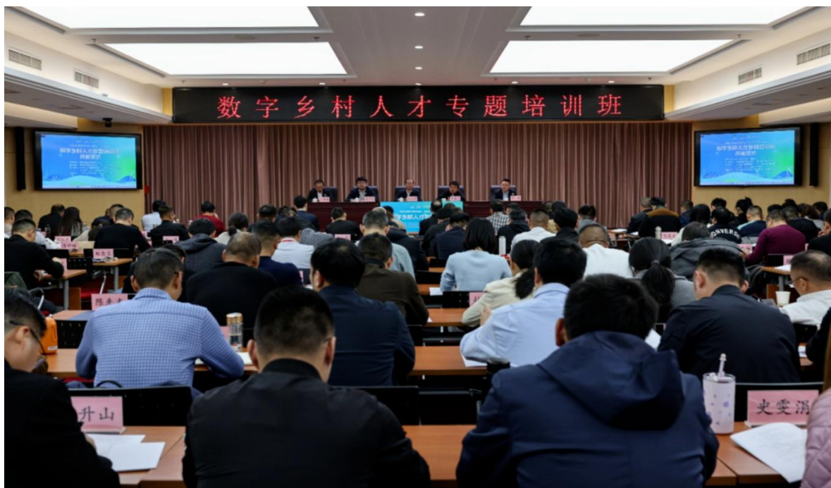
图10 第二期“数字乡村人才专题培训班”授课现场