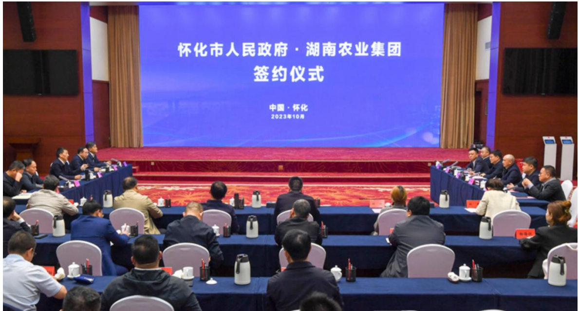
图2 怀化市与湖南农业集团签约仪式现场