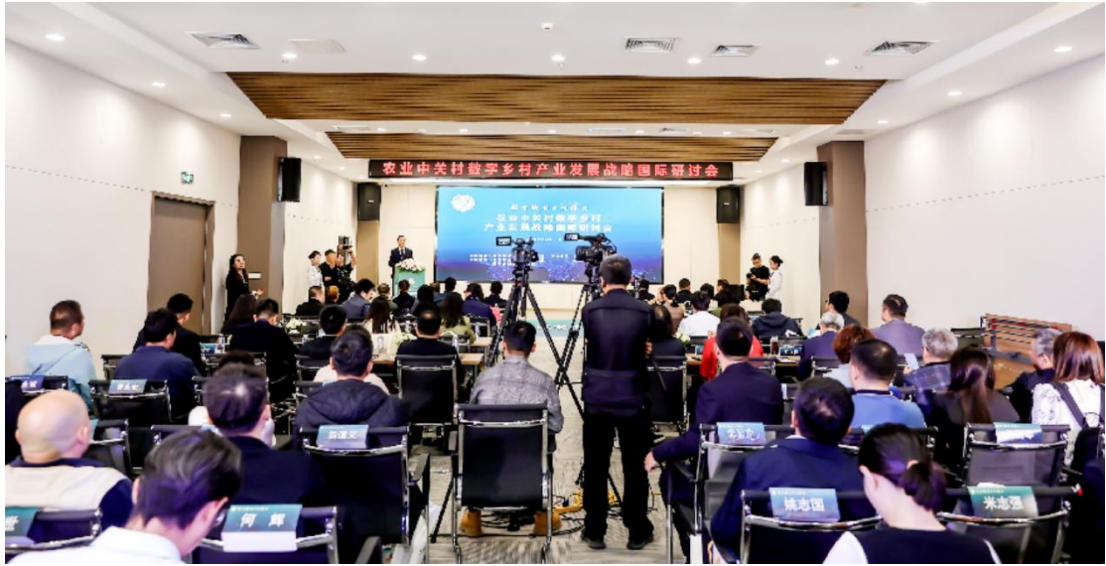
图 6 农业中关村数字乡村产业发展战略国际研讨会现场