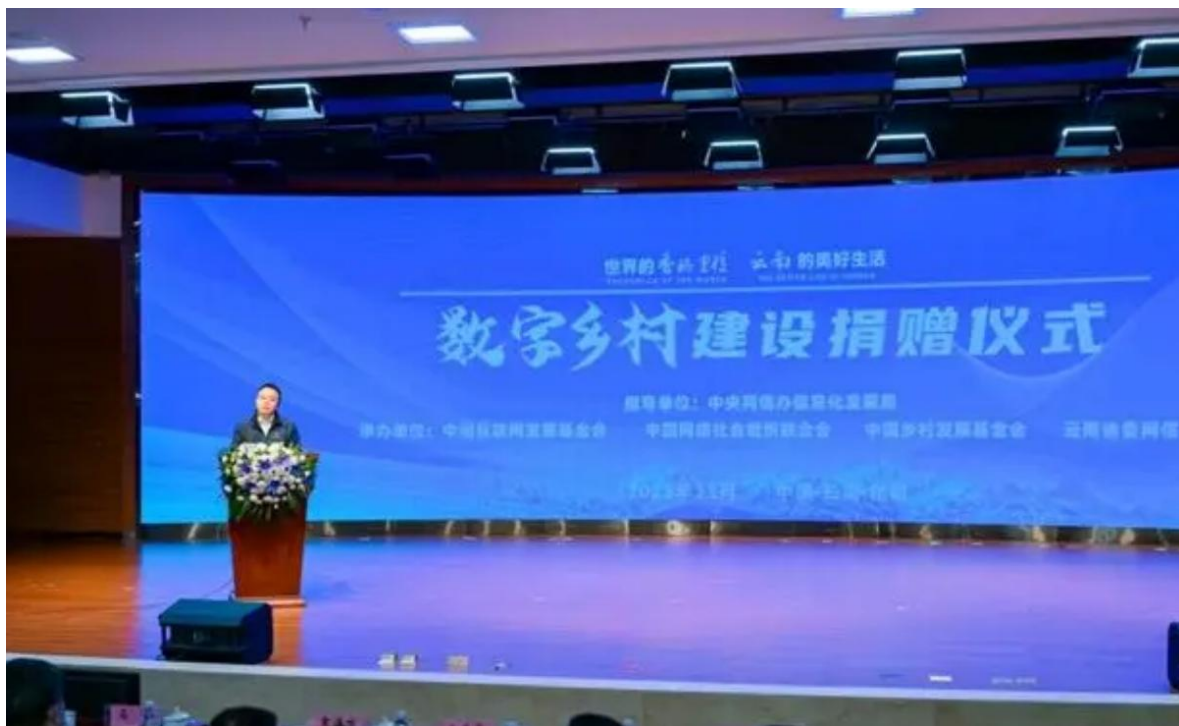
图8 云南数字乡村建设捐赠签约仪式