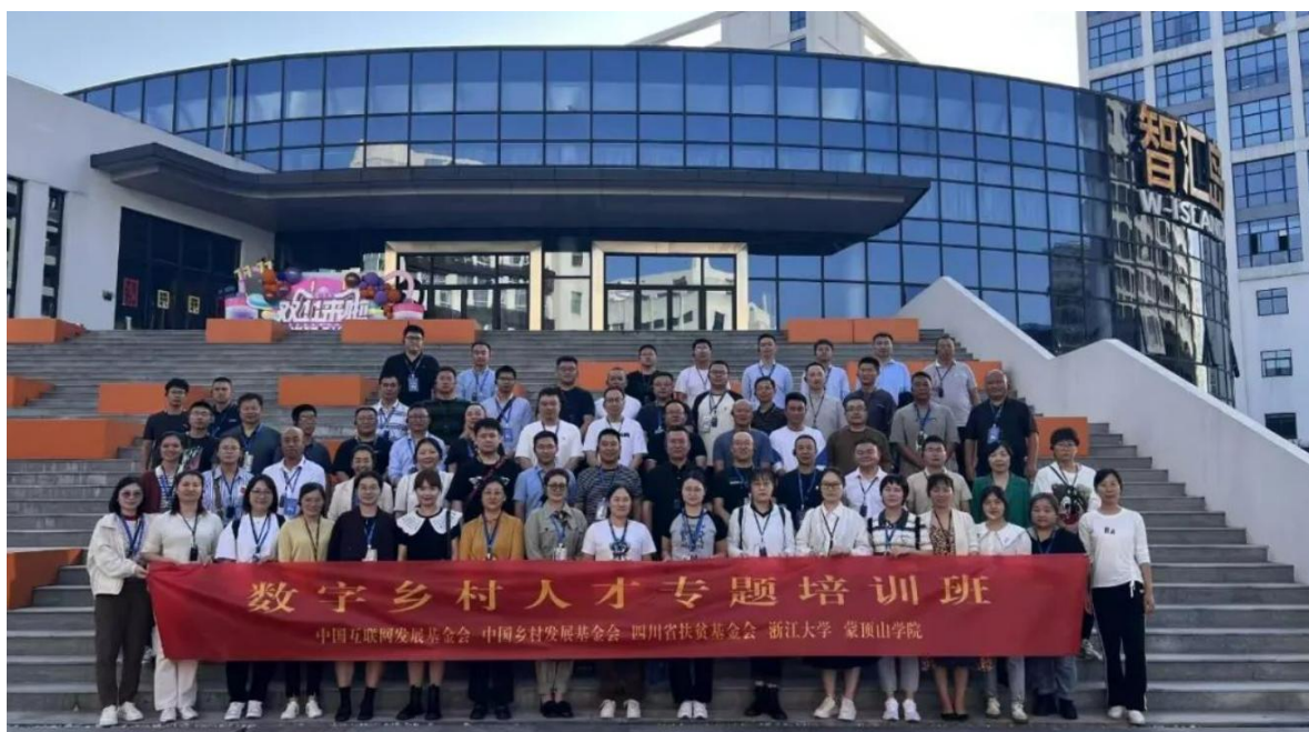
图9 第一期“数字乡村人才专题培训班”学员合照