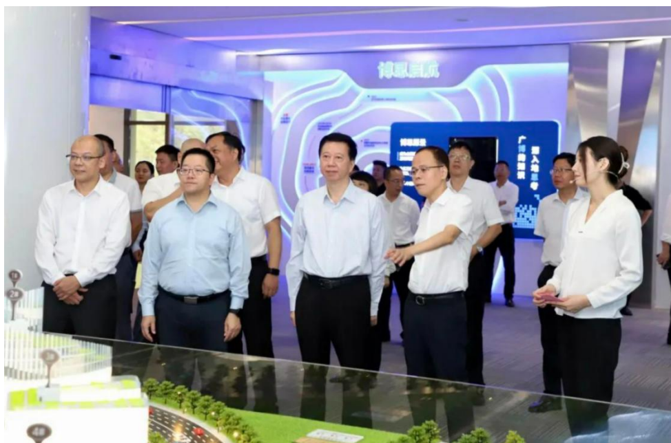
图3 调研组调研现场